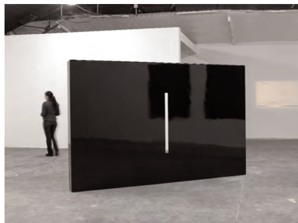
Nicolas Milhé, Meurtrière, 2008. Coproduction 40mcube - Buysellf.