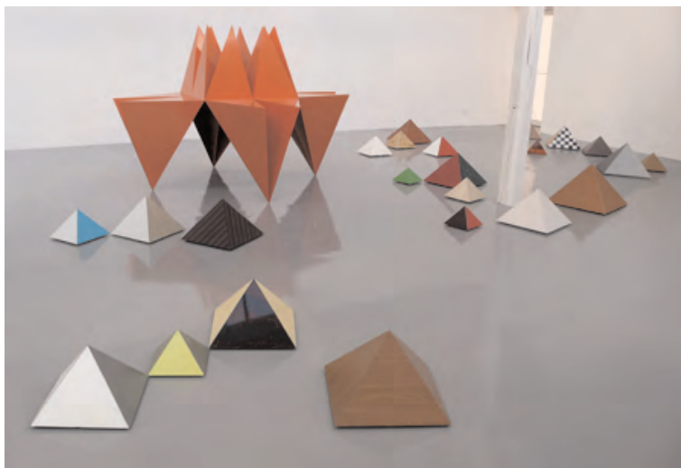
"Strategy & Tactics" 2008

(1) Michel de Certeau, L'Invention du quotidien , 1. Arts de faire, Paris : Gallimard, 1990.