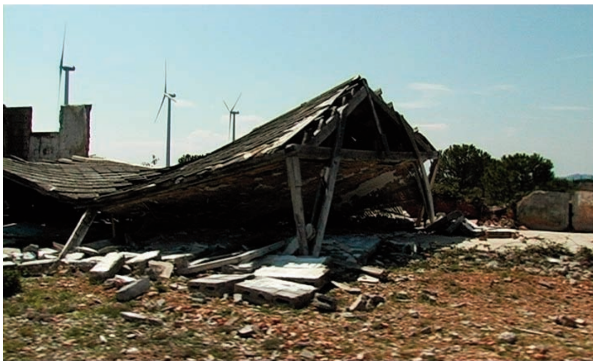
Un camp, cinq stèles 2009 Vidéo 60 min.

Vidéo-club d'art et d'essai Vidéodrome 8, rue Vian 13006 Marseille - Tel. 04 91 42 99 14 www.videodrome.fr