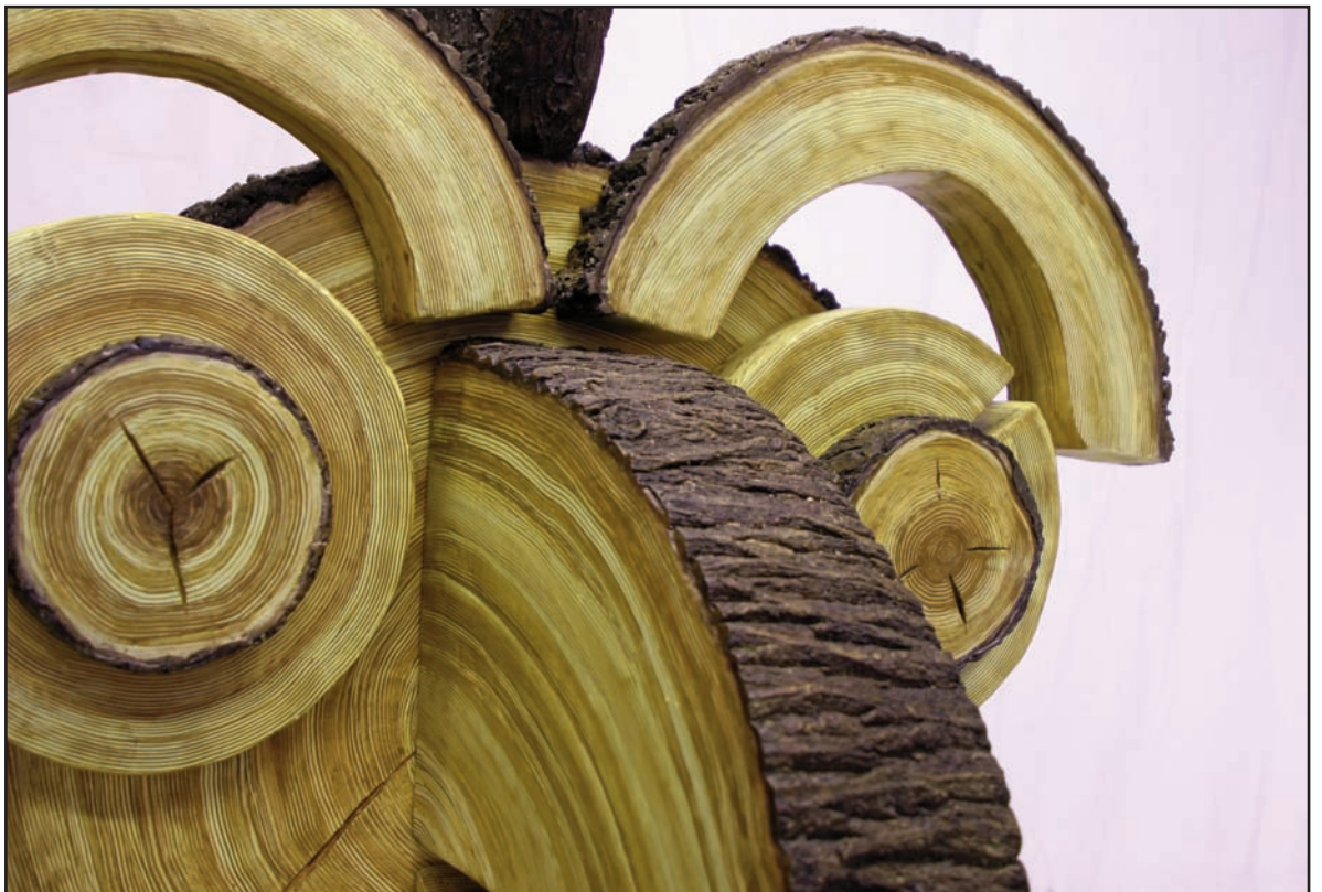
Woody , 2009 Polystyrène, résine 260 x 120 x 110 cm Production Buy-Sellf

Du mardi au samedi, de 14h00 à 19h00 et sur rendez-vous.