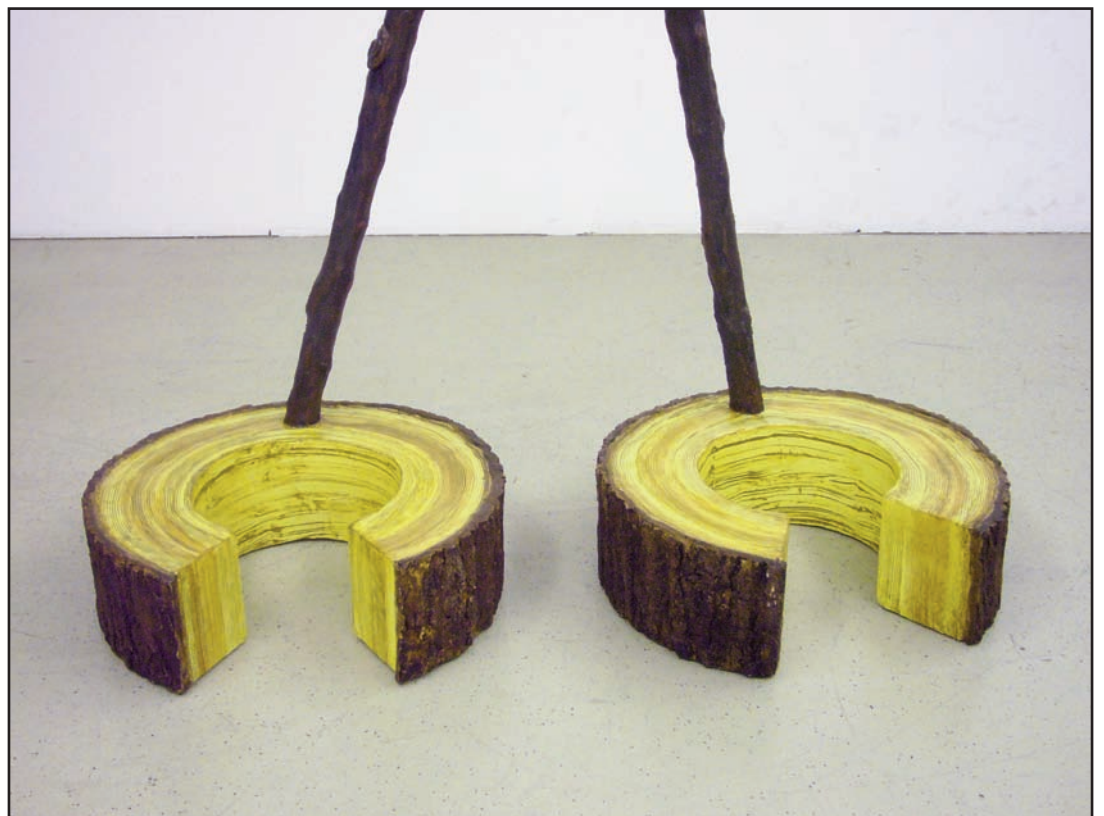
Woody , 2009

** Kopfertami ou Gopfertami , d'où dérivent Gopfritchtoutz , Gopfertelli ou encore Gopfertekrouest , est un juron assez puissant en dialecte suisse-allemand qui signifie en substance Bordel de nom de Dieu .